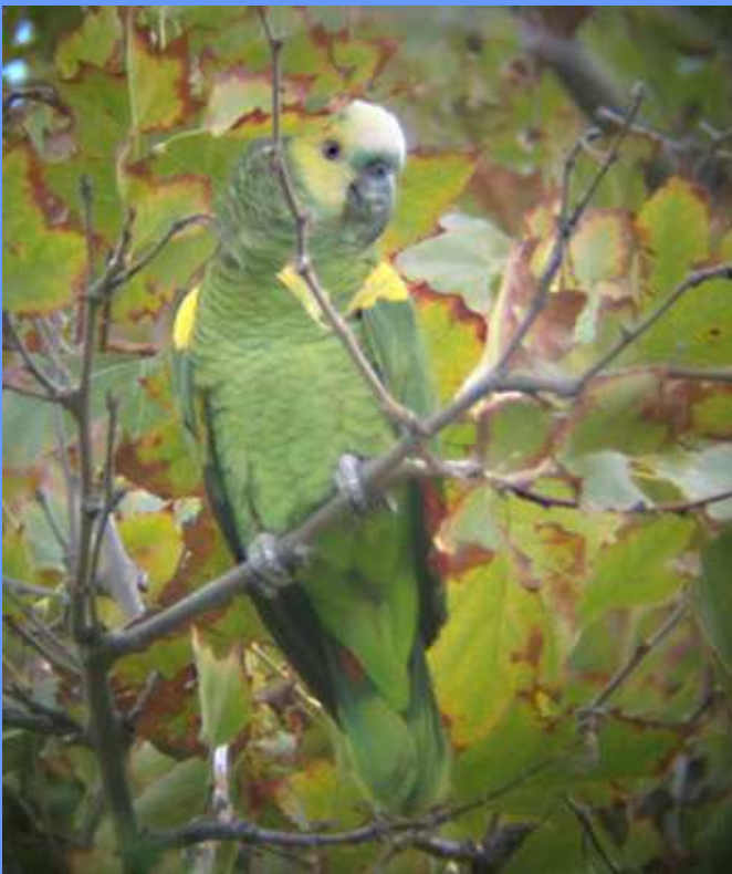
Amazona aestiva. Río Tordera, Barcelona, setiembre 2008.

Tordera ( Barcelona )