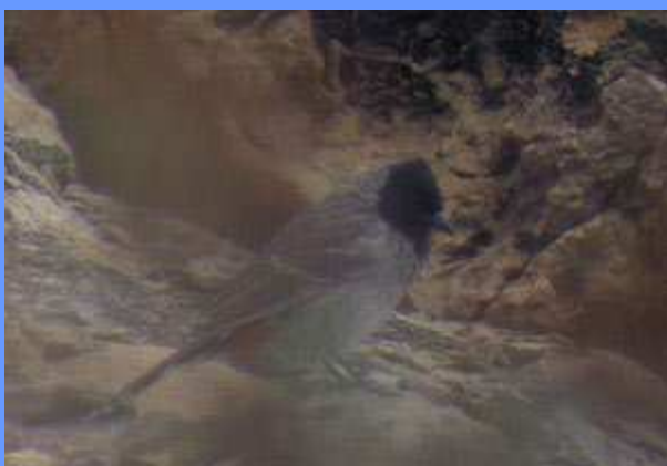
Pycnonotus cafer. Cabo Huertas, Alicante, setiembre 2008.

• 1 ej., 26.09.2008, cala Cantalar, cabo Huertas ( Alicante ). Posado tanto en el suelo como en arbustos, en una zona de acantilados de areniskas muy próxima del mar, con vegetación mediterránea de arbustos y matas (Miguel Ángel Andrés Moreno), fotos.