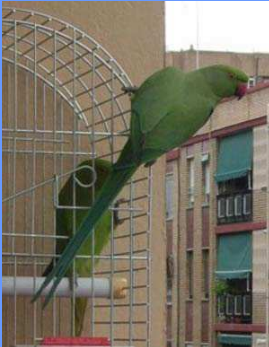
Psittacula krameri . Valencia, marzo 2008.