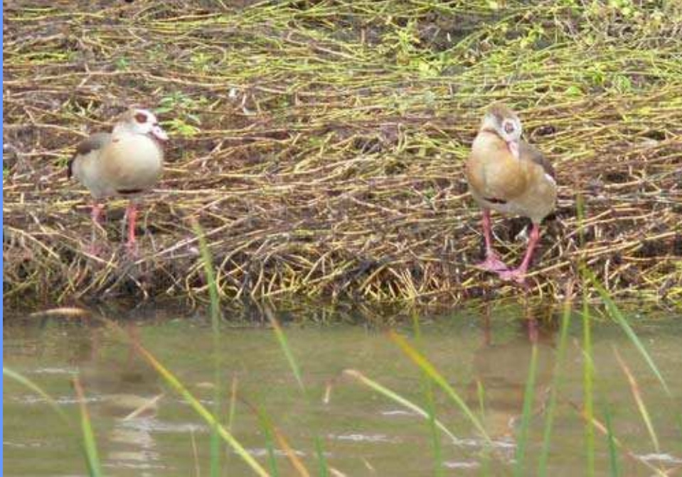
Alopochen aegyptiaca . Alboraya, Valencia, octubre 2008.

posterioridad, 3 ej. el 02.11 (J. Gómez Aparicio).