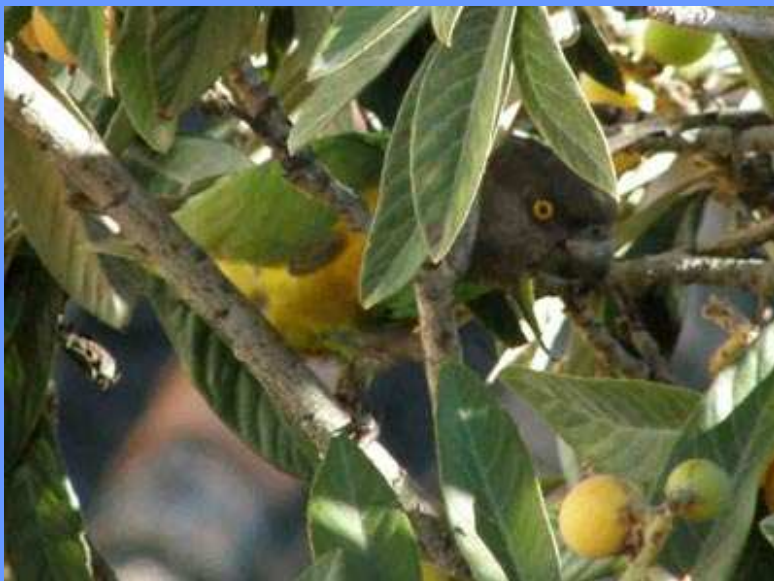
Poicephalus senegalus. Málaga, abril 2008. Foto: Antonio Toro.

mañanas en un níspero (Antonio Toro), fotos.