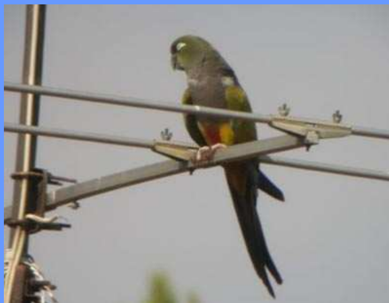
Cyanoliseus patagonus . Zuera, Zaragoza, junio 2008.