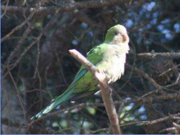
Myiopsitta monachus. San Javier, Murcia, agosto 2008.