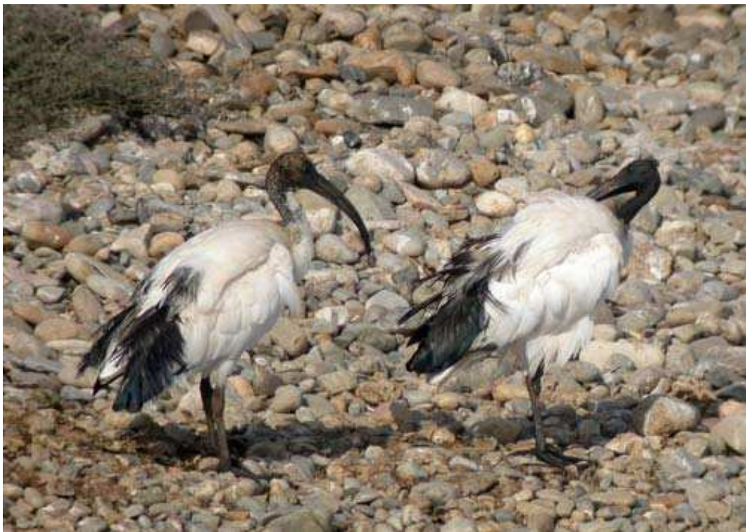
Ibis sagrado ( Threskiornis aethiopicus ). El Ejido, Almería, julio 2008.