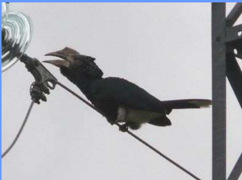
Ceratogymna brevis. Laguardia, Álava, mayo 2008.

de Juan), fotos. Ejemplar posiblemente escapado de un zoo cercano.