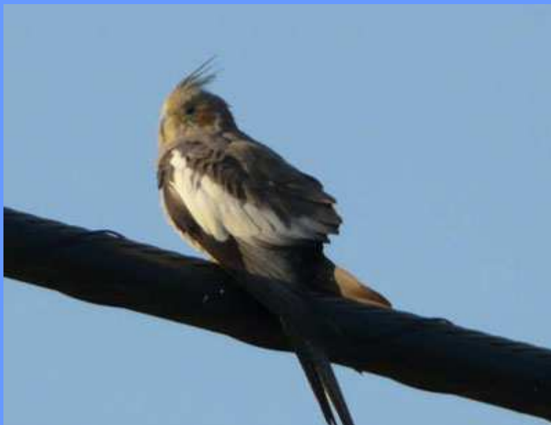
Nymphicus hollandicus. St. Llorenç de la Muga, Girona, agosto 2008.