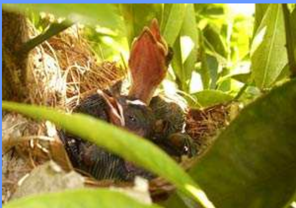
Pycnonotus jocosus. Paterna, Valencia, abril 2008.