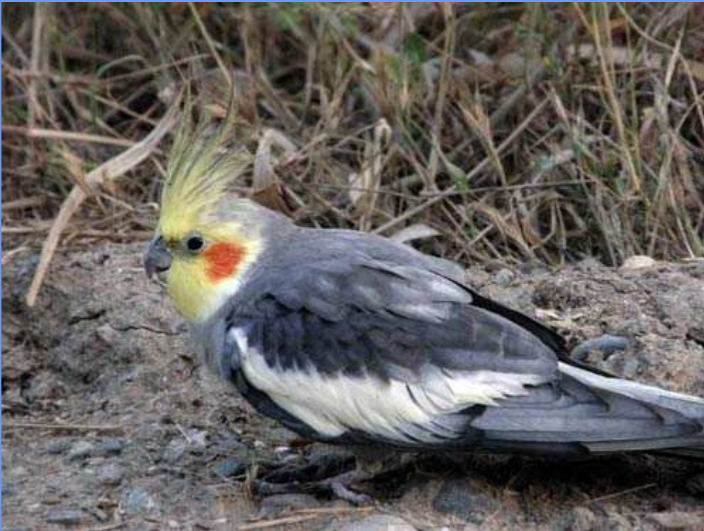
Nymphicus hollandicus (macho). Río Guadalhorce, Málaga, mayo 2008. Foto: Antonio Toro.

el carril junto al mirador de la laguna grande (Antonio Toro), foto.