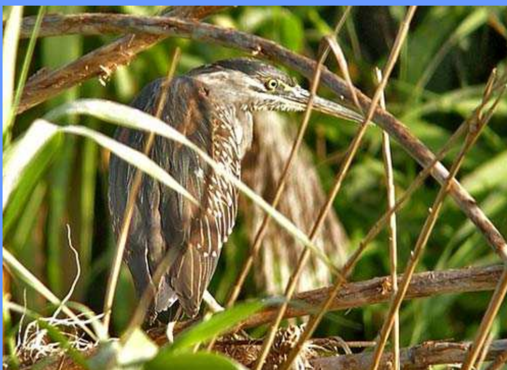
Butorides striata. Alboraya, Valencia, mayo 2008.

Oceanográfico de la Ciudad de las Artes y las Ciencias de Valencia debido a la rotura del mismo por los fuertes vientos (com. por Toni Polo). Fotos.