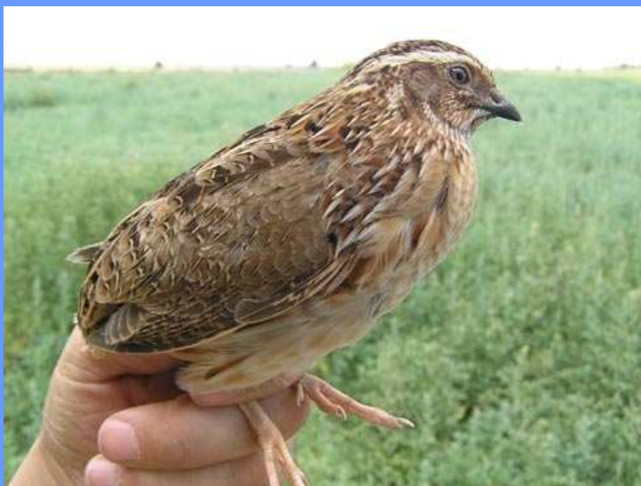
Coturnix japonica . Pinto, Madrid, junio 2008.