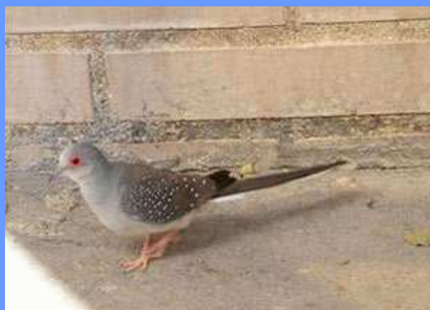
Geopelia cuneata . Rivas-Vaciamadrid, Madrid, octubre 2008.