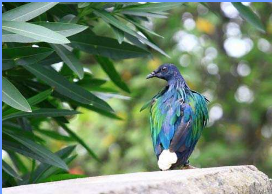
Caloenas nicobarica. Elgoibar, Guipúzcoa, octubre 2008.

ejemplar enviado a un coleccionista de la zona por un criador de Sevilla. Posiblemente se trata de un juvenil, por estar mudando algunas plumas y por la escasa protuberancia del pico (J.C. Fernández-Ordóñez).