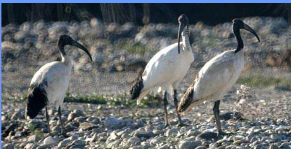
Threskiornis aethiopicus . El Ejido, Almeria, junio 2008.