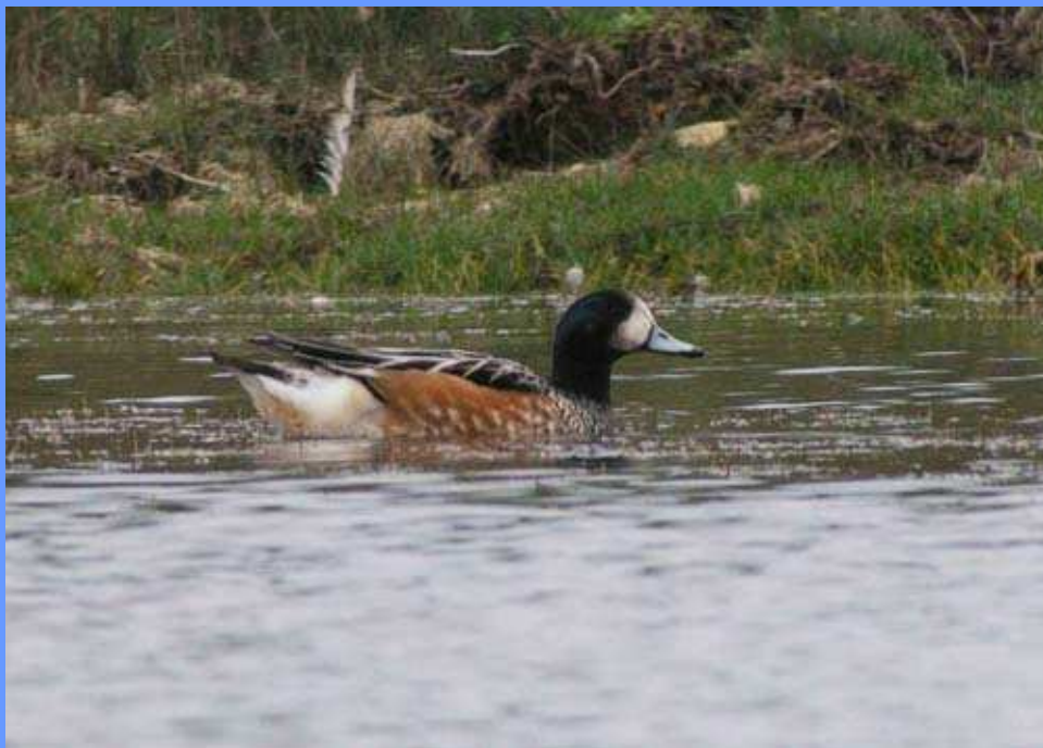
Anas sibilatrix. Begonte, Lugo, agosto 2008.