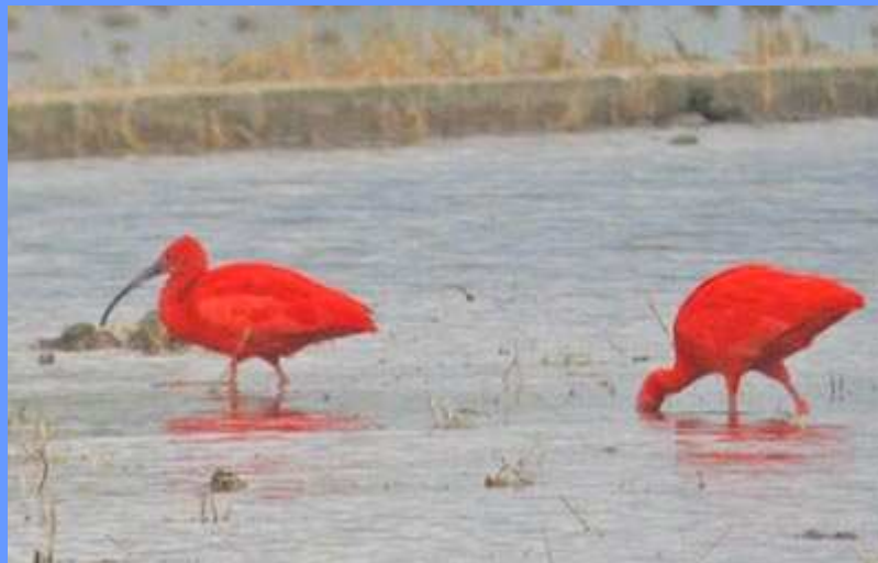
Eudocimus ruber . L'Albufera, Valencia, mayo 2008.

ciudad, en especial en la zona marítima (com. por Toni Polo). El 01.05 fueron vistos 4 ej. en arrozales de Sueca, en L'Albufera, alimentándose de cangrejo americano ( Procambarus clarki ) (Bosco Dies). Las aves no tenían marcas ni anillas. Fotos.