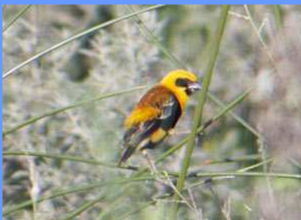
Euplectes hordaceus . Río Vélez, Málaga, octubre 2008.

grupo de gorriones comunes, Passer domesticus .