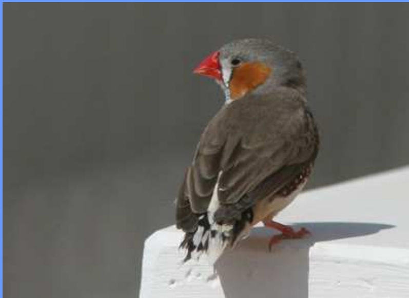
Taeniopygia guttata. San Javier, Murcia, marzo 2008.