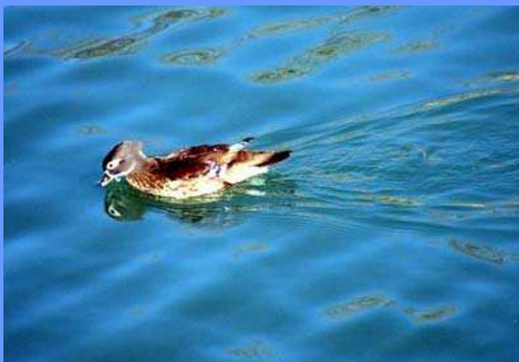
Aix sponsa. Aranjuez, Madrid, diciembre 2008.

como ocas y patos domésticos, ocupando una zona del río por debajo de un salto de agua, fotos. En 11.2008 había también una pareja en el Parque de Polvoranca, Leganes (Antonio Honorato Álvarez, Roberto Moreno González).