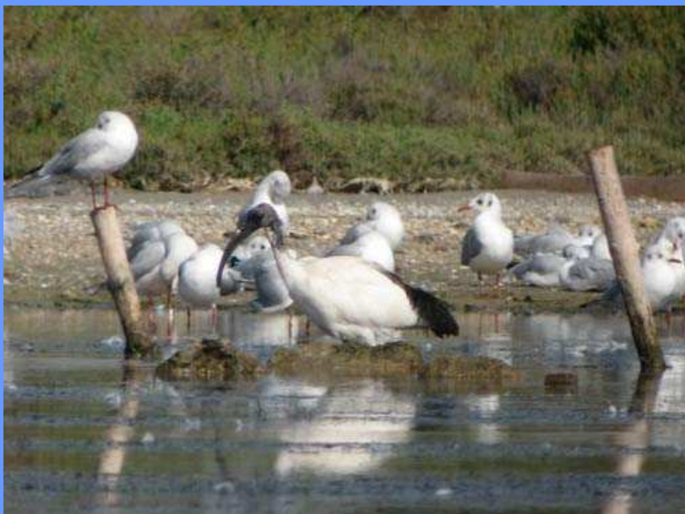
Threskiornis aethiopicus . San Pedro del Pinatar, Murcia, octubre 2008.