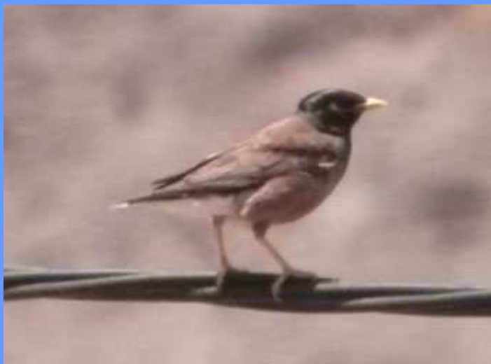
Acridotheres tristis. La Lajita, Fuerteventura, julio 2008.