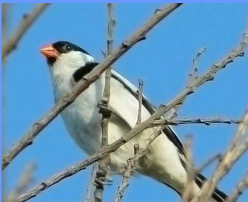
Vidua macroura . Río Congost, Granollers, Barcelona, agosto 2008.

anteriores, más arriba en el río Congost, en La Garriga (com. por Ferran J. Lloret). Fotos.