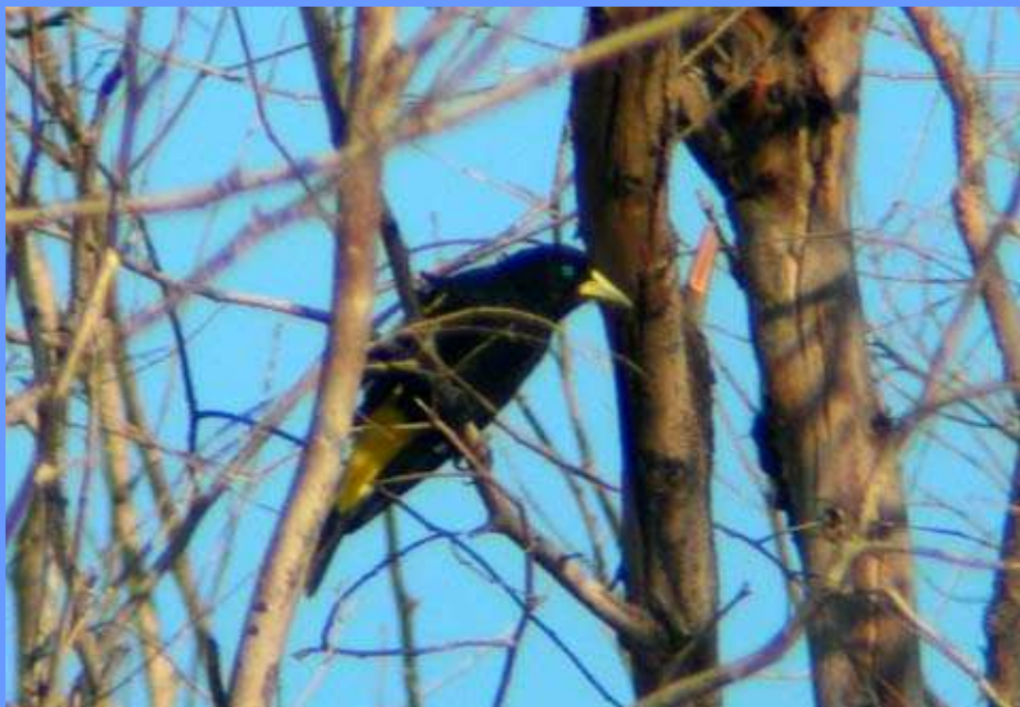
Cacicus cela. Málaga, abril 2008.