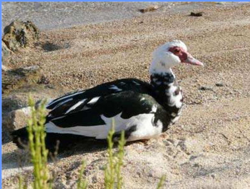
Cairina moschata. Estany des Peix, Formentera, junio 2008. Barbara Klahr.