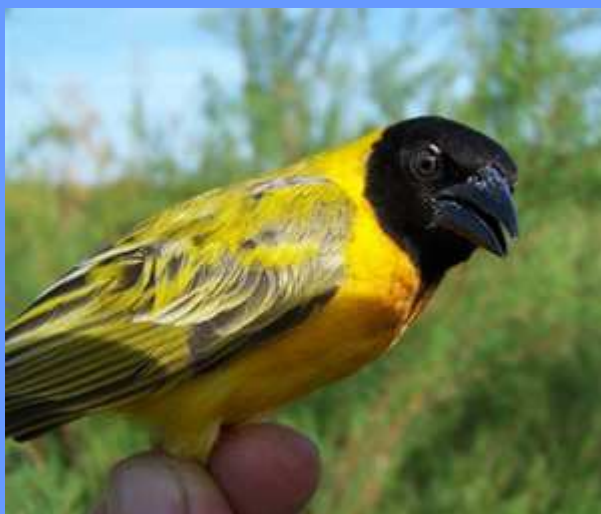
Ploceus melanocephalus. Brazo del este, Sevilla, abril 2008.