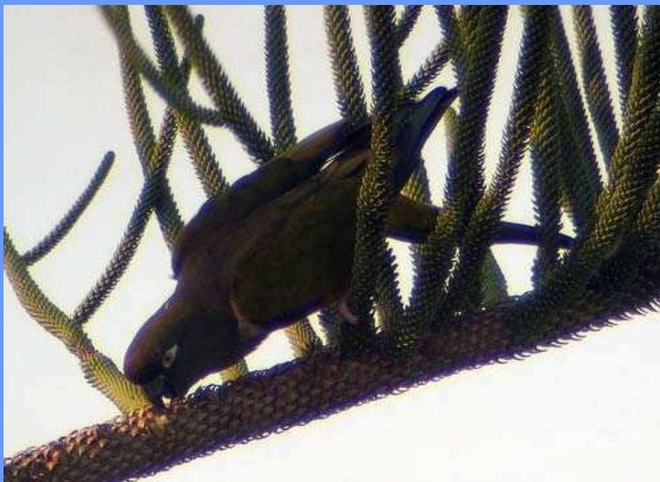
Cyanoliseus patagonus . El Puerto de Sta. María, Cádiz, noviembre 2008.