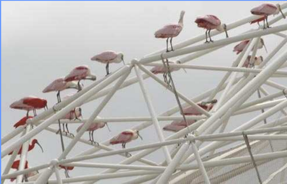
Platalea ajaja (derecha) y Eudocimus ruber (izquierda). Oceanográfico de Valencia, abril 2008.

viento. Varios ejemplares fueron vistos merodeando por amplias zonas de la ciudad, en especial en la zona marítima. Al día siguiente fue visto 1 ej. en vuelo sobre el Racó de l'Olla (com. por Toni Polo).