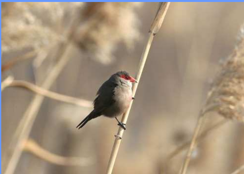
Estrilda astrild . R.N. del delta del Llobregat, Barcelona, enero 2007.

● 1 ej., macho, durante 2007, Jardines de Mendez Nuñez y Parque de Santa Margarita, ciudad de A Coruña (Amadeo A. Pombo Eirín y Mariana Roura Sánchez).