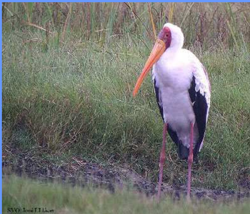
Mycteria ibis. P.N. de la Marjal de Pegó-Oliva, Alacant, agosto 2006.