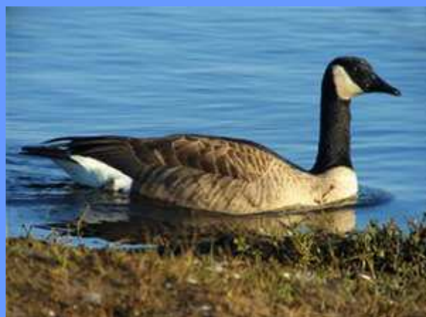
Branta canadensis. Pontevedra, 2007.