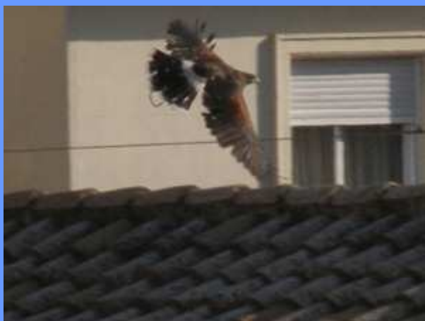
Parabuteo unicinctus . València, marzo 2007.