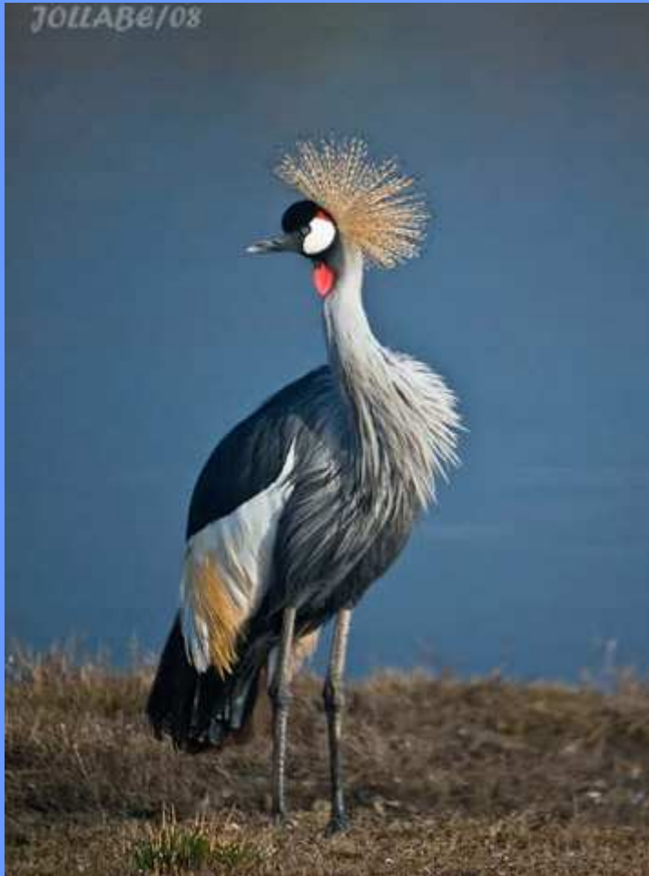
Balearica regulorum. Albufera de Muro, Mallorca, febrero 2008.