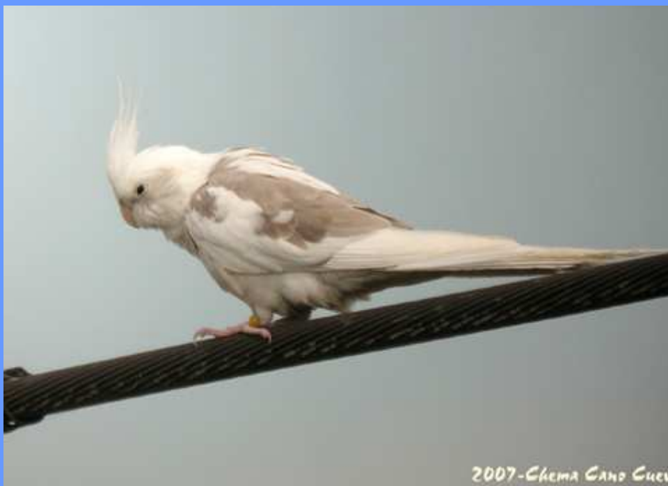
Nymphicus hollandicus (parte de coloración albina). Lora del Río, Sevilla, marzo 2007.