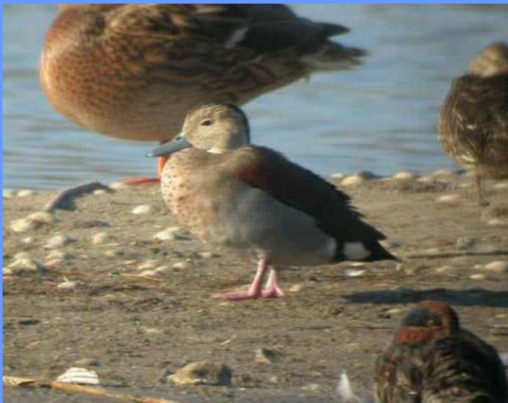
Callonetta leucophrys. Albufera de València, noviembre 2007.