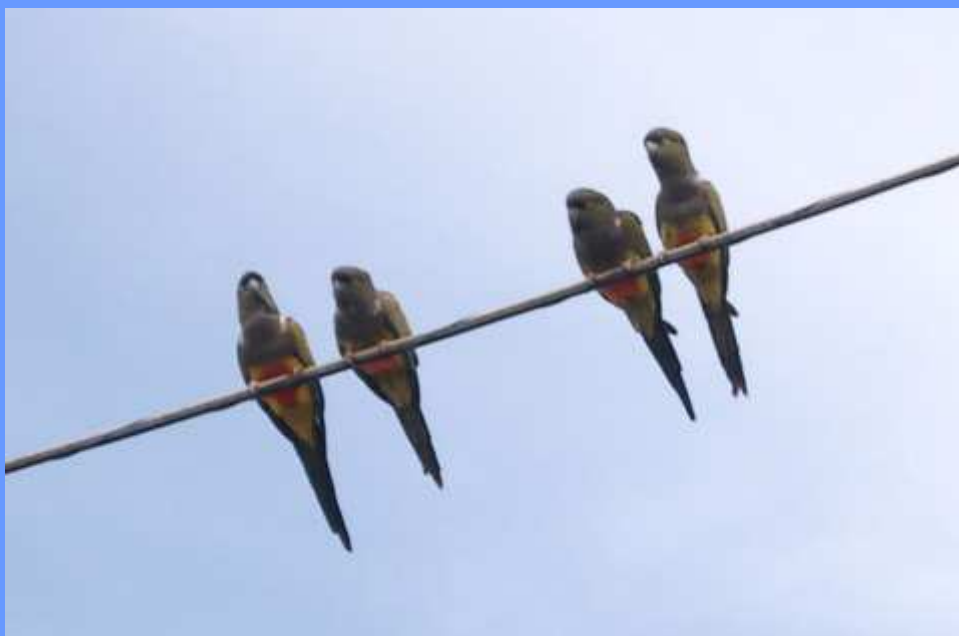
Cyanoliseus patagonus . Cartagena, Murcia, marzo 2006.