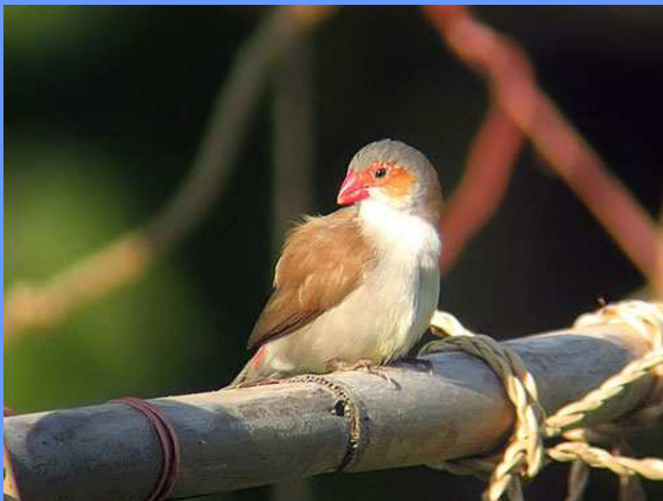
Estrilda melpoda . Sevilla, julio 2007.