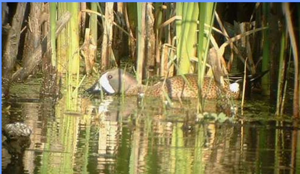
Anas discors. Xunqueira de Alba, Pontevedra, mayo 2007.