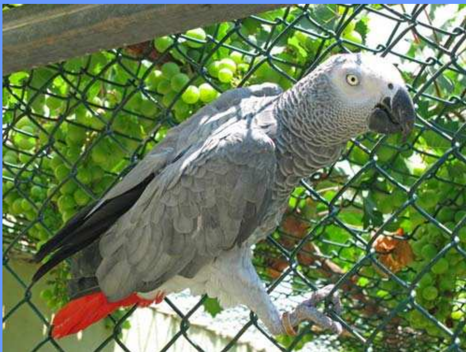
Psittacus erithacus . Alfaz del Pi, Alacant, julio 2007.