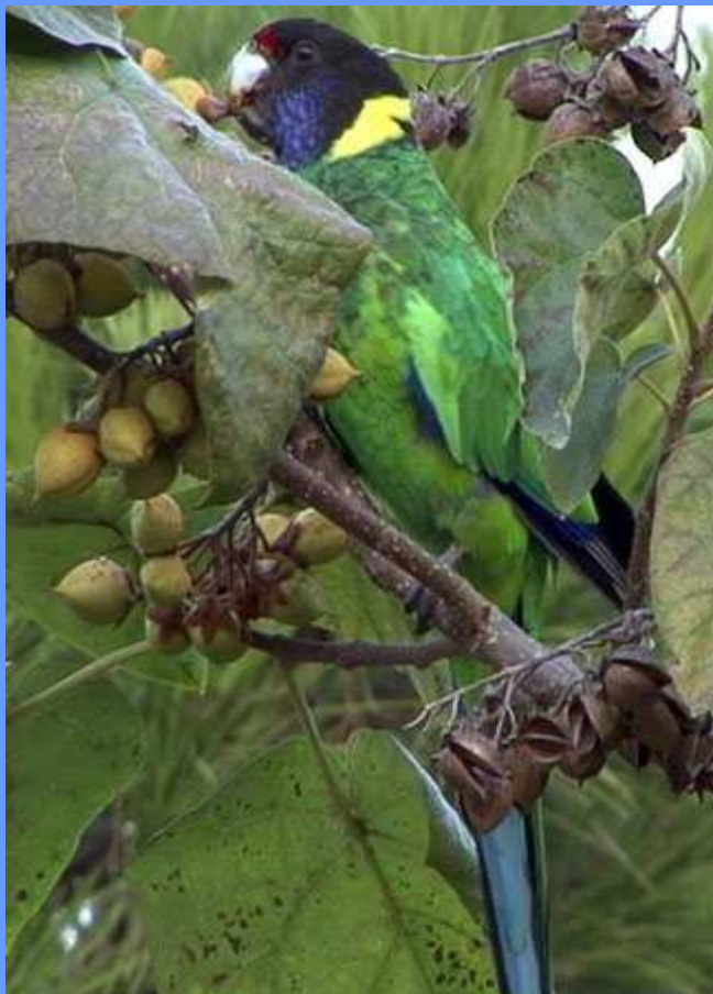
Barnardius zonarius. Bellaterra, Barcelona, 2007.