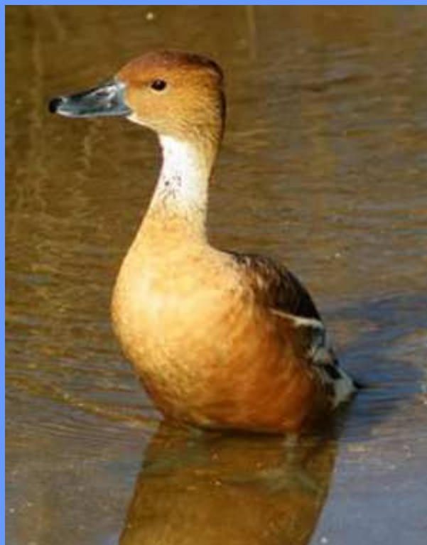
Dendrocygna bicolor. Nigrán, Pontevedra, 2007.

Ant. Noticiarios: Citas: 5; Años: 03, 04, 05, 06; Máx ind: 1.