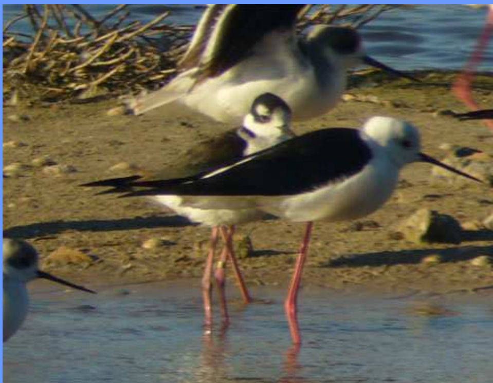
Himantopus mexicanus (ejemplar del centro). Albufera de València, diciembre 2007.