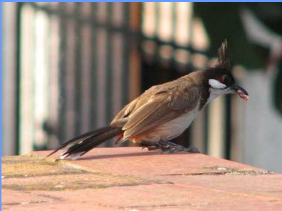
Pycnonotus jocosus . Paterna, València, agosto 2007.

• Nidificación en La Cañada/ Paterna ( València ) durante 2007 (Francisco Gresa). El 13.01 se observó 1 ej. en La Cañada. El 25.02 se observaron 8 ej. en El Plantío, seis sobre un grupo de palmitos elevados ( Trachycarpus fortunei ) y seguidamente una pareja más. Foto. El 04.03 se observaron 12 ej. en Paterna. Foto. El 03.08 se observa también en Paterna dos adultos alimentando un pollo, que se encuentra muerto el 05.08. En la zona existe una colonia reproductora de la especie desde 2003.