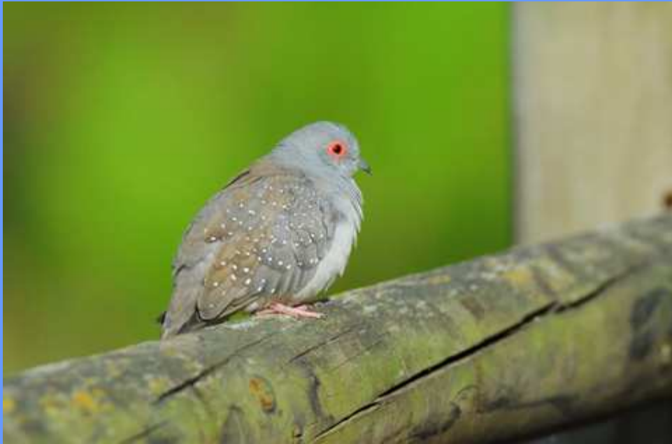
Geopelia cuneata . R.N. del delta del Llobregat, Barcelona, agosto 2007.