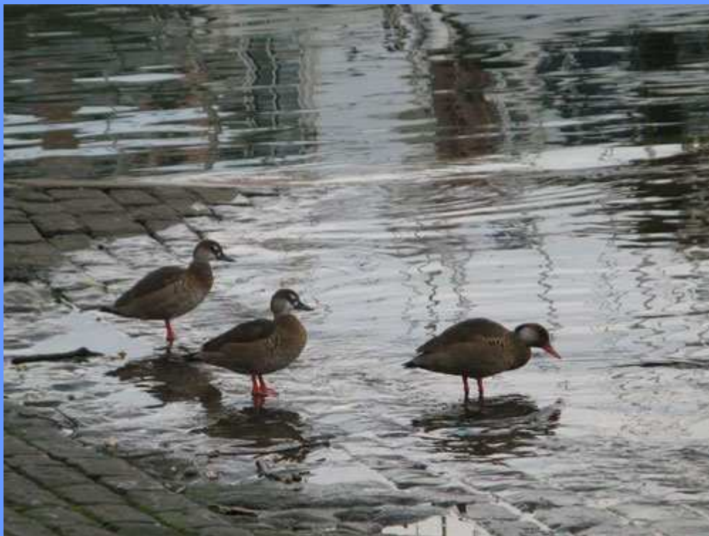
Amazonetta brasiliensis. Getxo, Bizkaia, noviembre 2007.