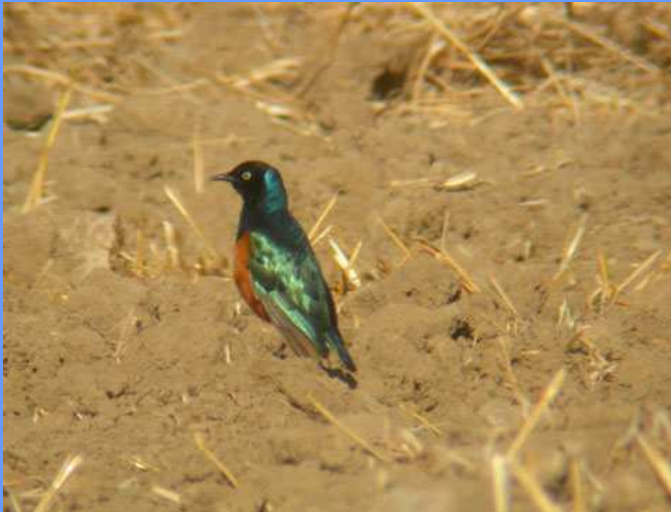
Lamprotornis superbus. Río Guadalhorce, Málaga, junio 2007.