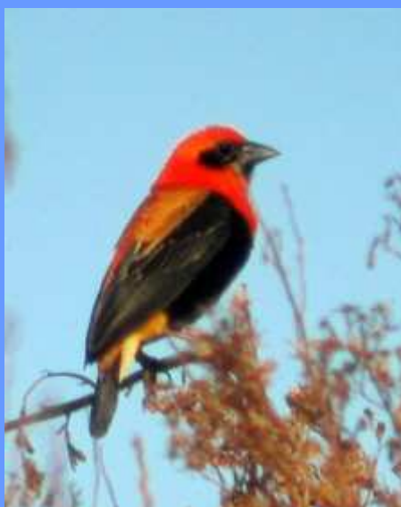
Euplectes hordaceus . Baiona, Pontevedra, octubre 2007.