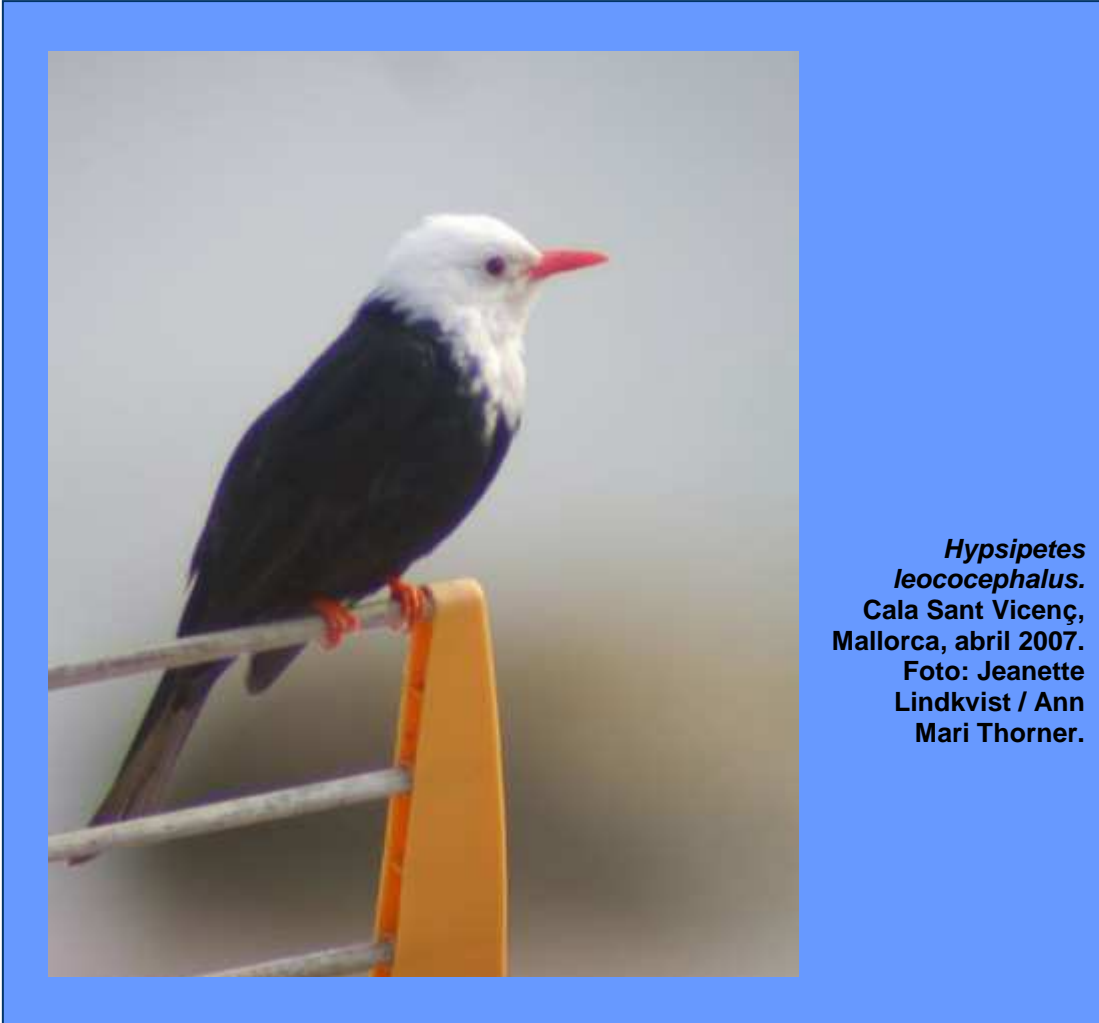
Hypsipetes leucocephalus. Cala Sant Vicenç, Mallorca, abril 2007.