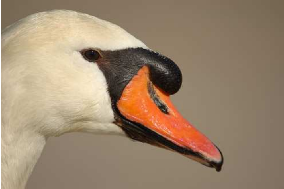
Cisne vulgar ( Cygnus olor ).