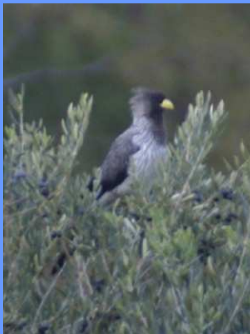
Crinifer piscator. Coín, Málaga, diciembre 2007.