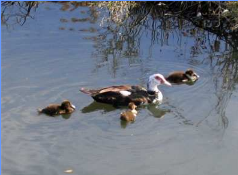
Cairina moschata. Pontevedra, 2007. Foto: César Vidal.