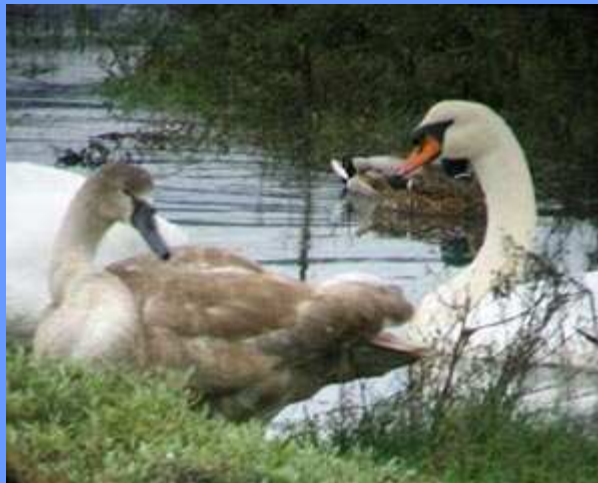
Cygnus olor. Pontevedra, 2007.