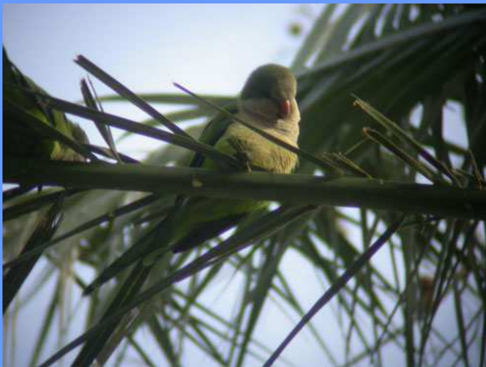
Myiopsitta monachus . Barcelona, enero 2007.