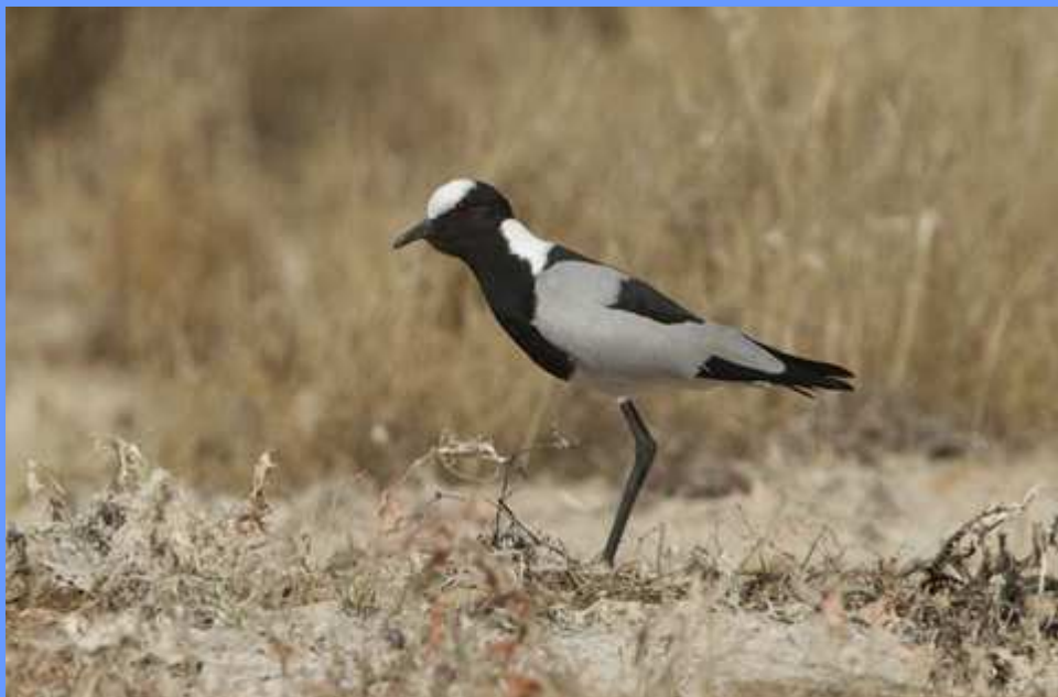
Vanellus armatus. El Fraile, Tenerife, febrero 2007.

isla de Tenerife en 2005 (comunicado por Juan José Ramos Melo al CR-SEO), aunque no constaba que ninguno de ellos hubiera escapado.