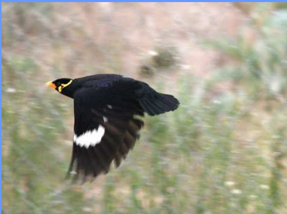
Gracula religiosa. R.N. del delta del Llobregat, Barcelona, setiembre 2007.