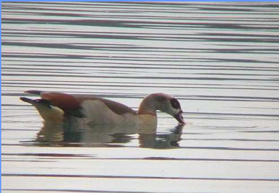
Alopochen aegyptiaca . Estany de Banyoles, Girona, abril 2007.