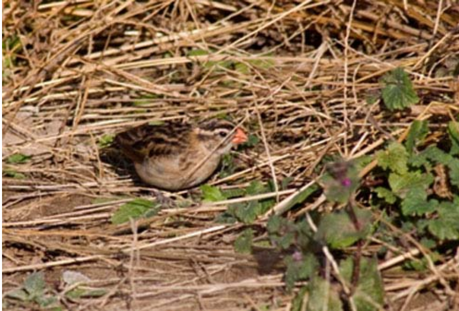
Vidua macroura , Gavà (Barcelona), diciembre 2005.