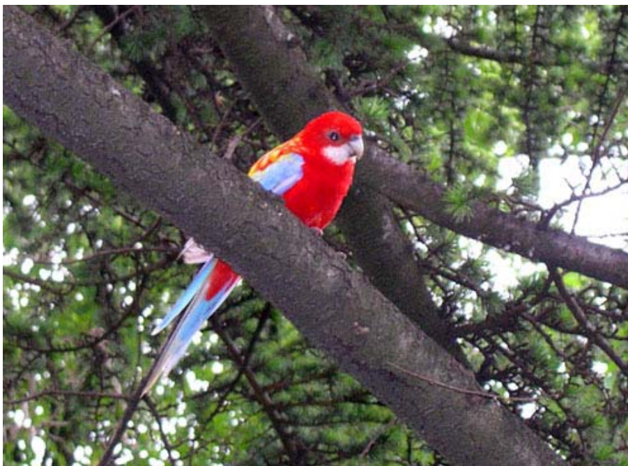
Platycercus eximius , Vic ( Barcelona ), junio 2004.