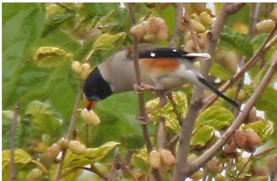
Eophona migratoria , delta del Llobregat (Barcelona), mayo 2005.