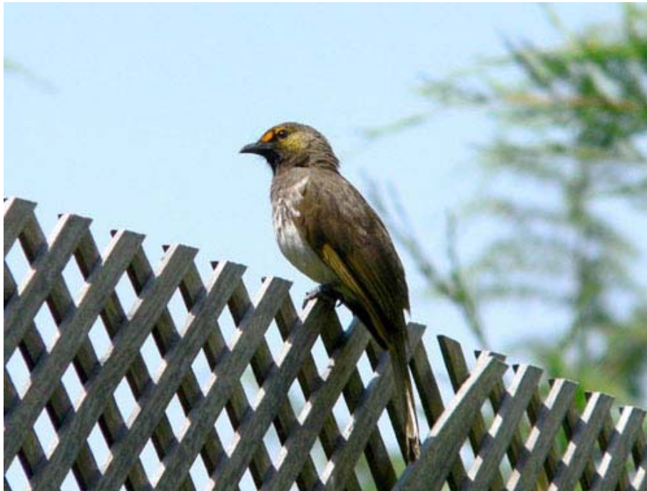
Pycnonotus bimaculatus , parque Faunia (Madrid), junio 2005.