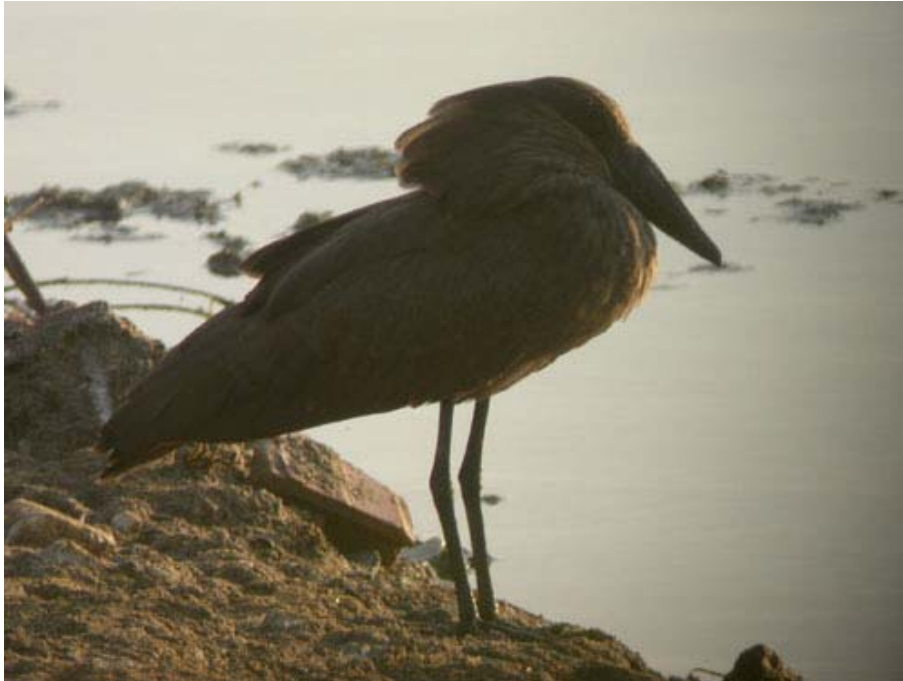
Scopus umbretta , Reserva del Río Guadalhorce ( Málaga ), setiembre 2005. Foto: Dave Flumm.