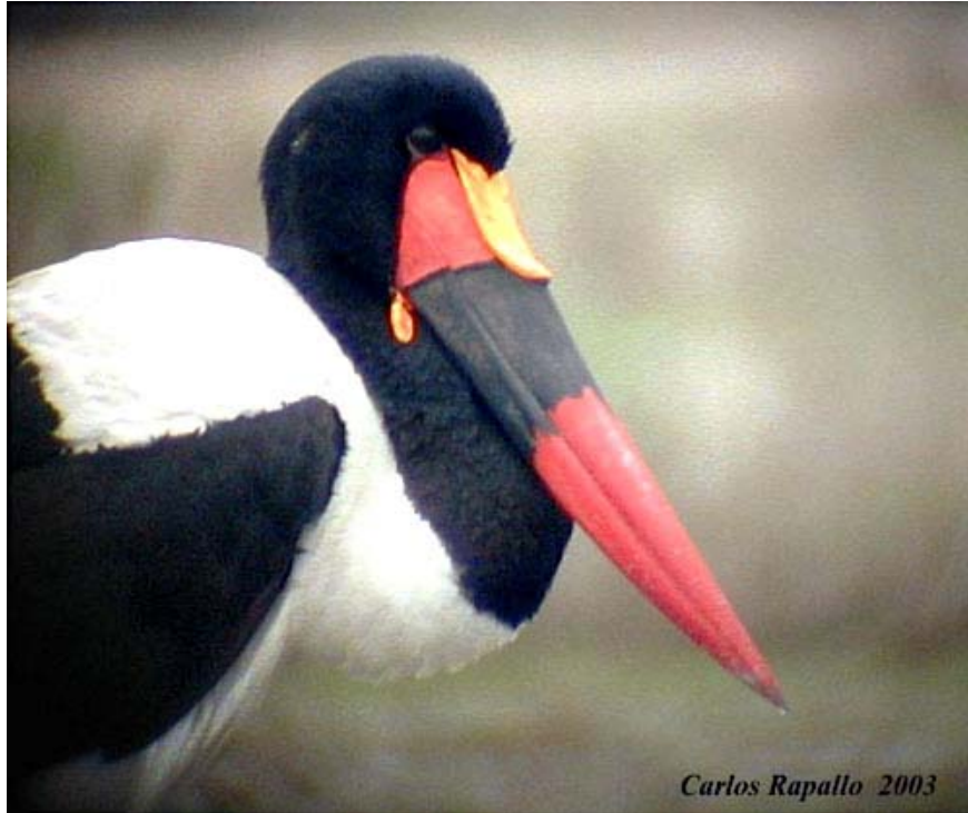
Ehippiorhynchus senegalensis , Doñana, noviembre 2003.