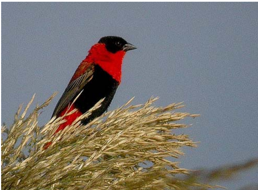
Euplectes franciscanus , río Vélez (Málaga), octubre 2005.