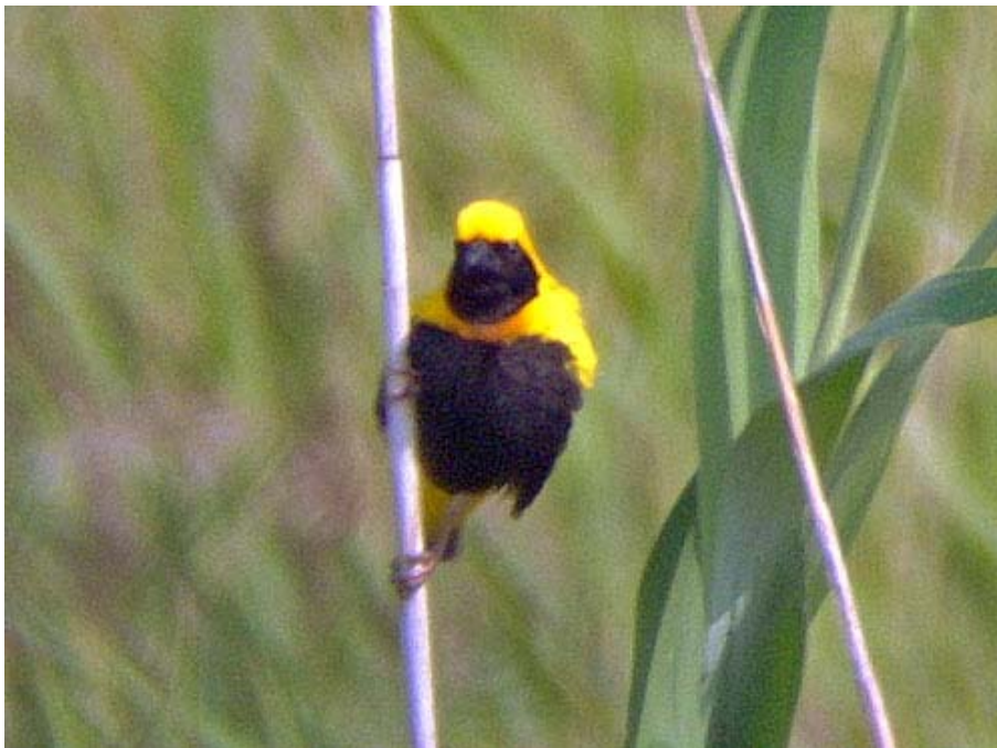
Euplectes afer , Racó de l'Olla, L'Albufera (Valencia), setiembre 2003.