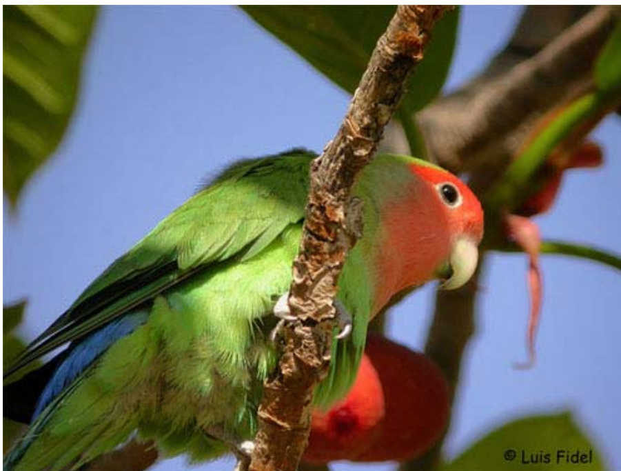
Agapornis roseicollis , Parque de San Blas (Alicante), 2003.