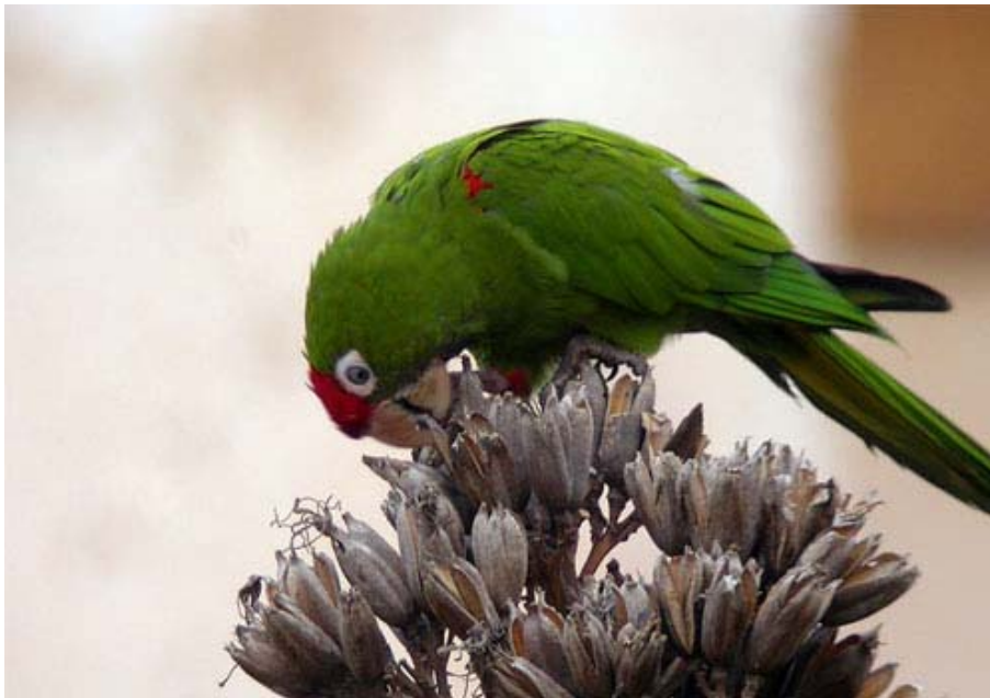
Aratinga wagleri , C.R.F. Santa Faz (Alicante), setiembre 2003.