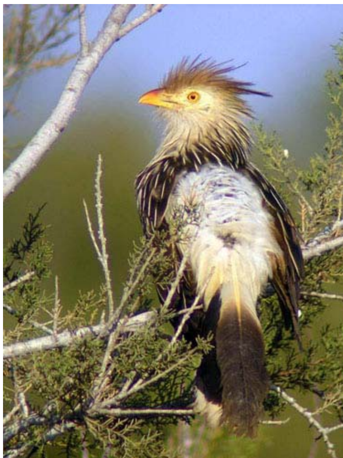
Guira guira , desembocadura del río Guadalhorce ( Málaga ), setiembre 2005.

• 2 ej., finales de agosto 2005, desembocadura del río Guadalhorce ( Málaga ) (Blas López). Siguen allí a principios de setiembre (Ángel García); el 26.9.05 (José Luis Bustamante); a mediados de octubre (Ángel García); y el 16.12.05 (Francisco Díaz). También se observaron cerca de la urbanización Guadalmar (Andy Paterson). Fotos.