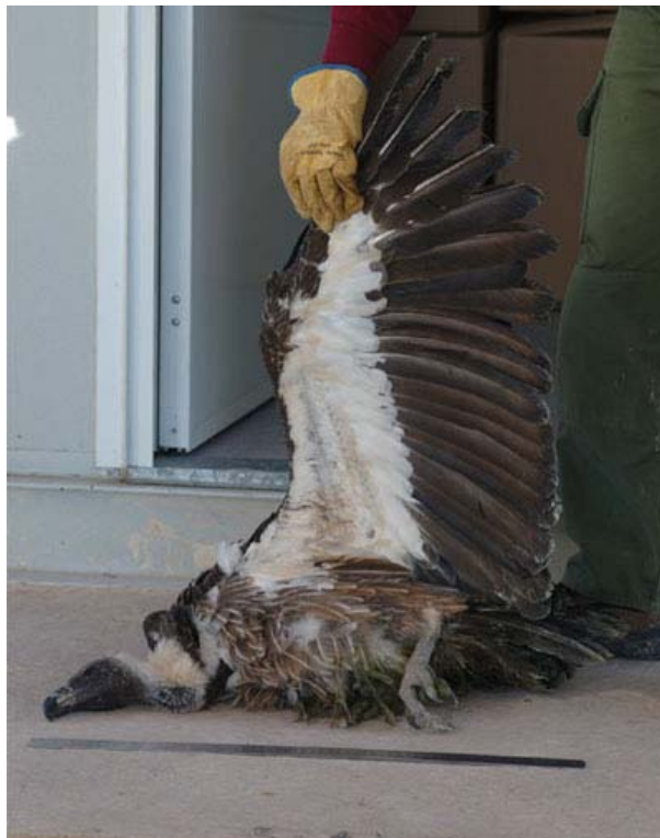
Gyps africanus , San Fulgencio (Alicante), noviembre 2005.