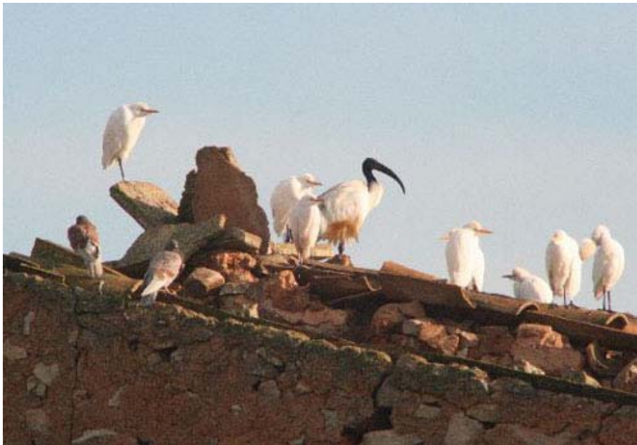
Threskiornis aethiopicus , depuradora de Felanitx (Mallorca), noviembre 2005.