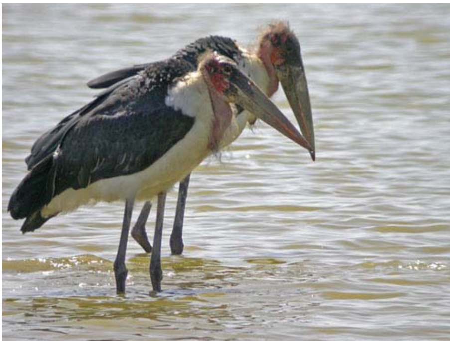
Leptoptilos crumeniferus , P.N. de las Salinas de Santa Pola (Alicante), agosto 2003.