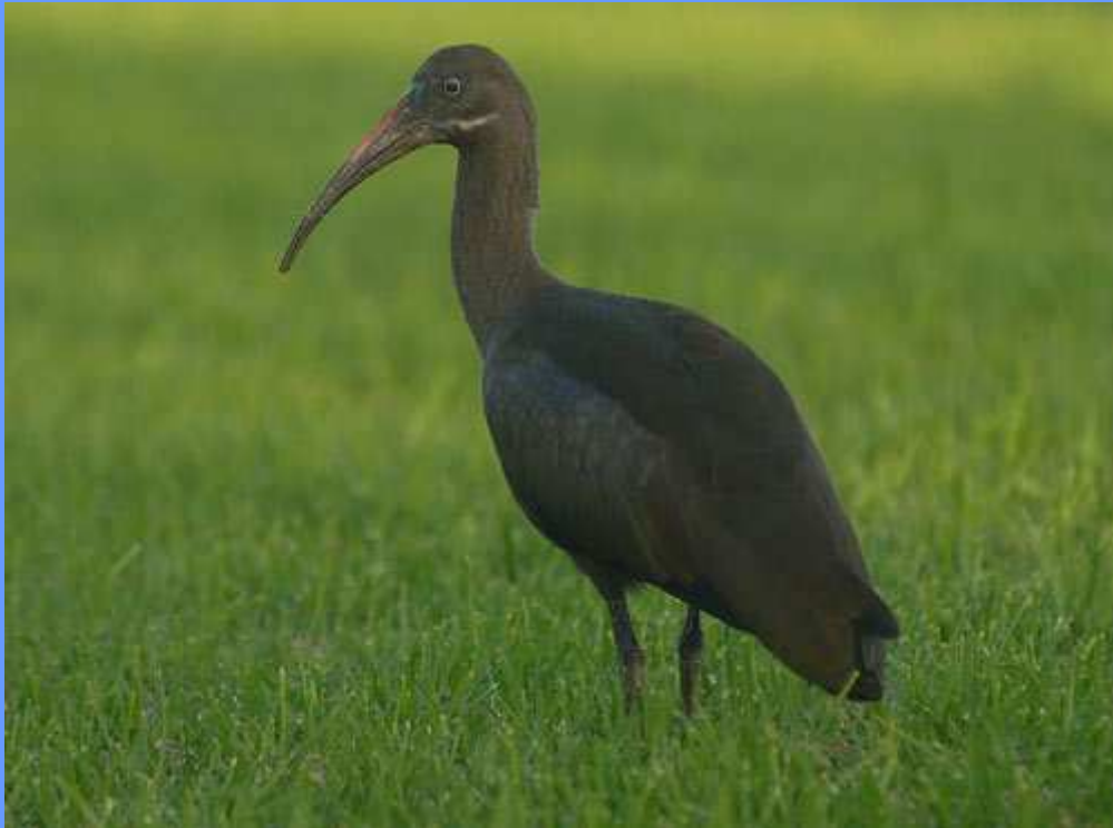
Bostrychia hagedash. Jandía, Fuerteventura, noviembre 2009.

perteneciente a un núcleo zoológico muy cercano (Domingo Trujillo, com. por Toño Lorenzo). Fotos.