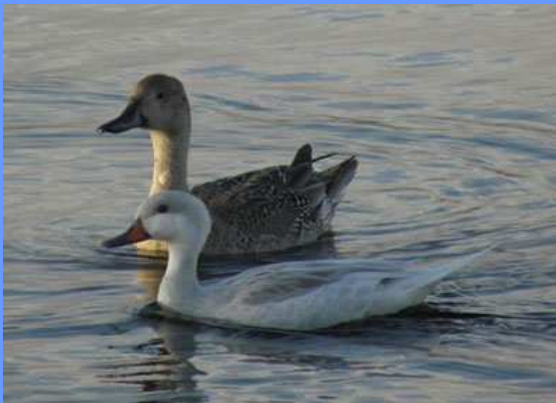
Anas bahamensis . Charca del Fraile, Arona, Tenerife, noviembre 2009.