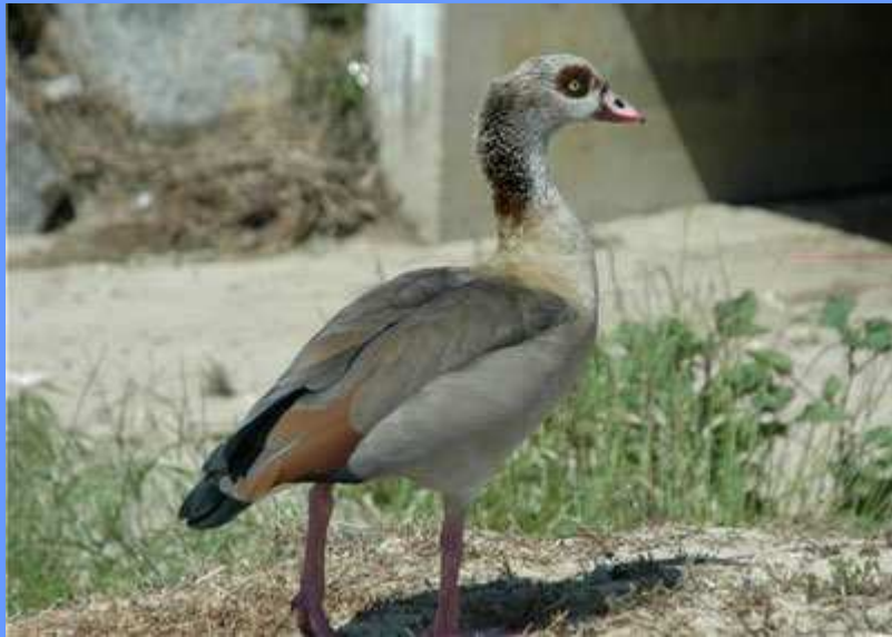
Alopochen aegyptiaca . Sant Vicenç de Montalt, Barcelona, mayo 2009.