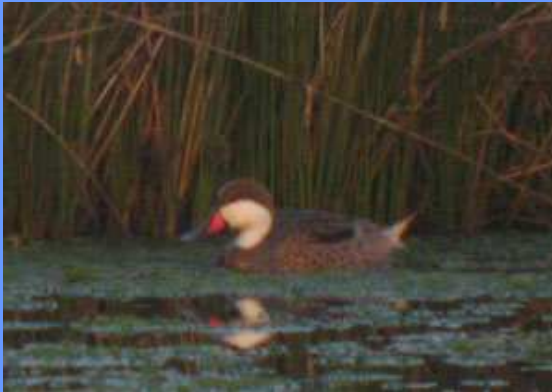
Anas bahamensis . Marismas de Santoña, Cantabria, enero 2009.