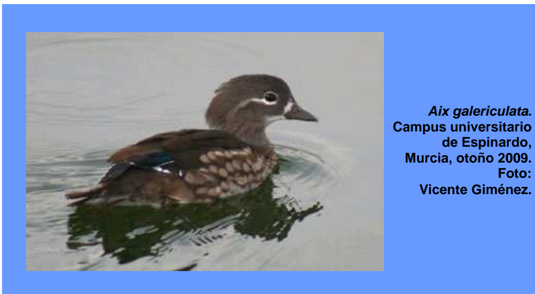
Aix galericulata. Campus universitario de Espinardo, Murcia, otoño 2009.