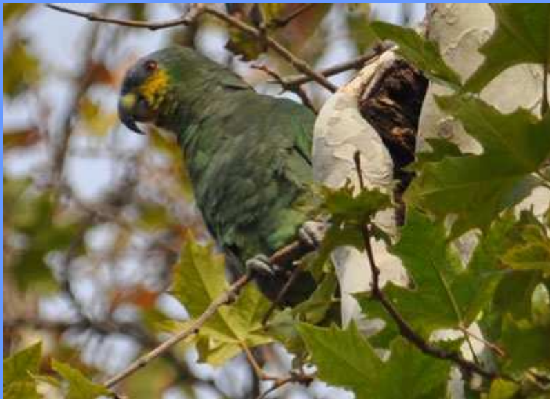
Amazona amazonica. Parque de María Luisa, Sevilla, noviembre 2009.