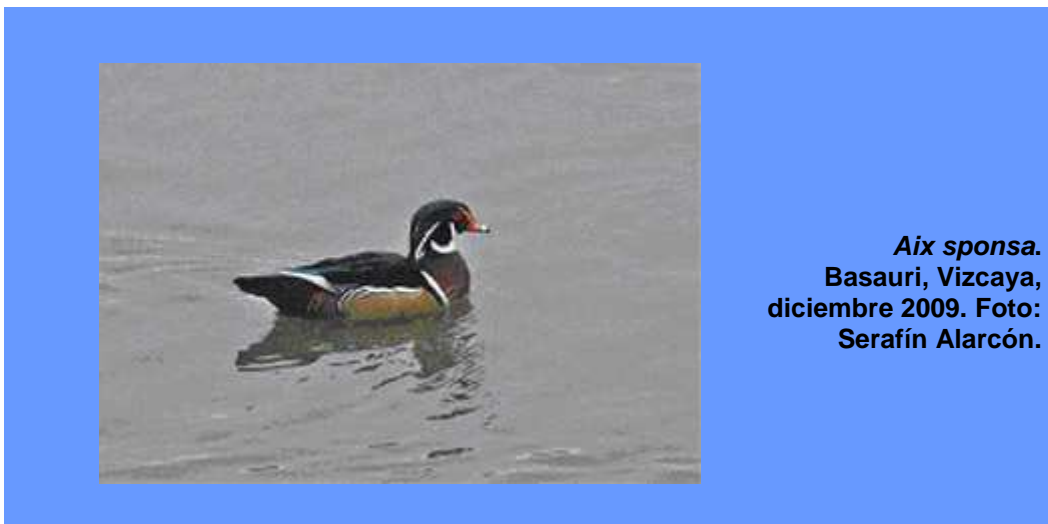
Aix sponsa. Basauri, Vizcaya, diciembre 2009.

• 1 ej., macho, 08.12.2009, río Nervión a su paso por Basauri ( Vizcaya ), frente a MercaBilbao (Serafín Alarcón).