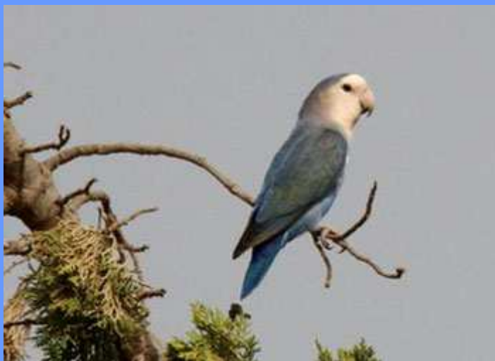
Agapornis roseicollis, var. cobalto. Playa Honda, Lanzarote, setiembre 2009.