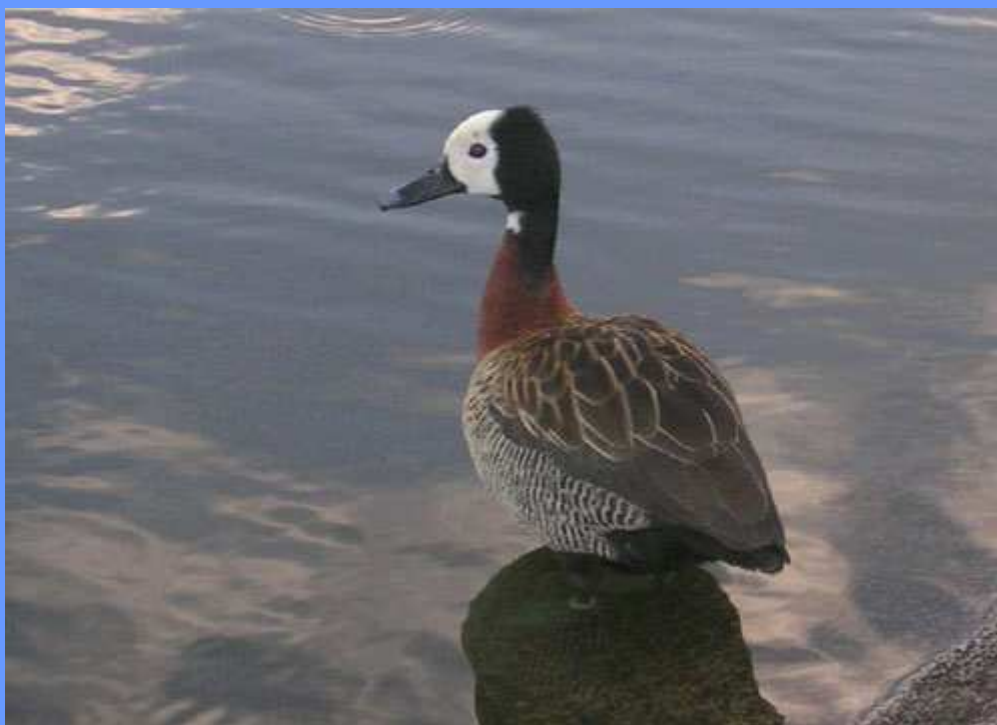
Dendrocygna viduata. Castillo de Fuste, Fuerteventura, marzo 2009.

canelos silvestres (Juan Antonio Lorenzo). Tiene anilla blanca que denota su origen como escape de cautividad, aunque vuela perfectamente y en ocasiones abandona el lugar.