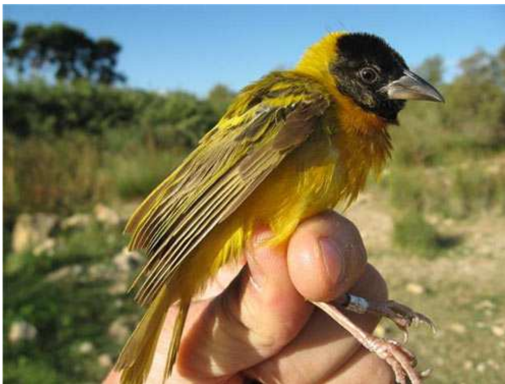
Tejedor de cabeza negra ( Ploceus melanocephalus ). Río Turia, Paterna (Valencia), noviembre 2009.

A menudo han sido agrupadas en una única entrada todas las citas que corresponden aparentemente al mismo ejemplar o al mismo grupo de ejemplares, o que describen la misma situación. En este caso se suelen excluir las citas que, dentro del conjunto, resultan más repetitivas.