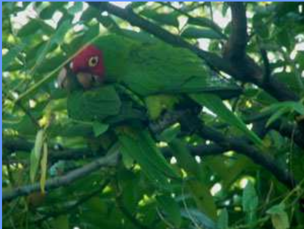
Aratinga erythrogenys. Jardín Botánico, Valencia, noviembre 2009.

• 42 ej., 28.12.2009, Jardines del Real, ciudad de Valencia (Anuario Ornít. Com. Valenciana 2009: PGR).