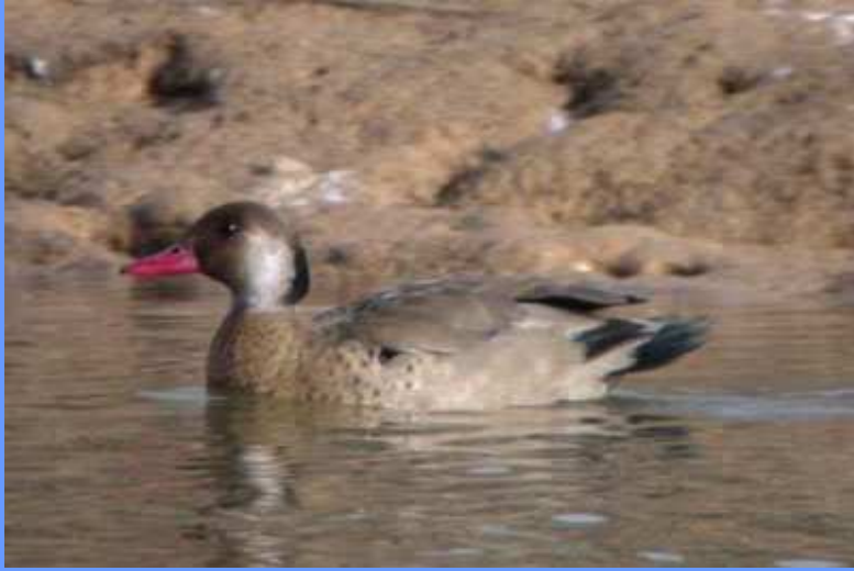
Amazonetta brasiliensis . Estany d'Ivars, Lleida, febrero 2009.