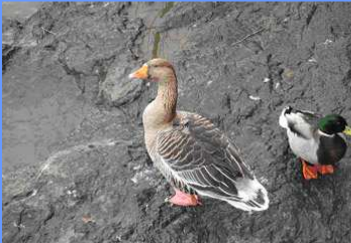
Anser anser. Bilbao, Vizcaya, diciembre 2009.