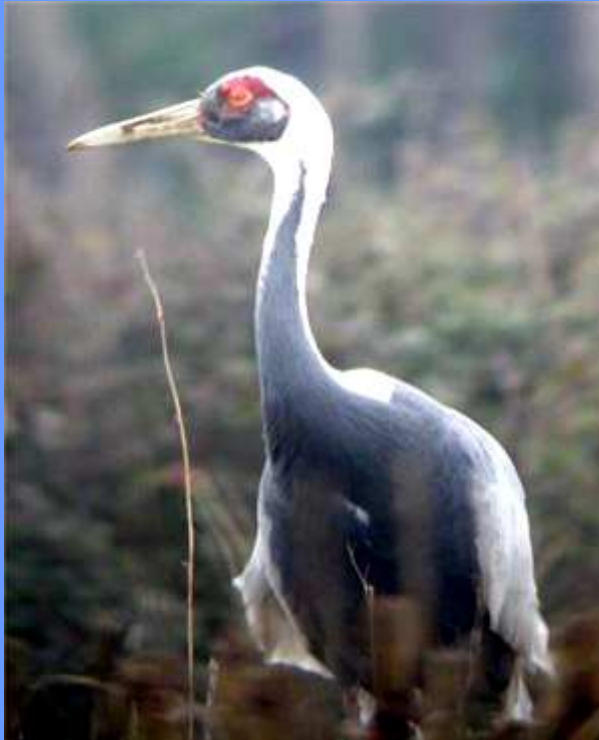
Grus vipio. Villadún, Castropol, Asturias, enero 2009.