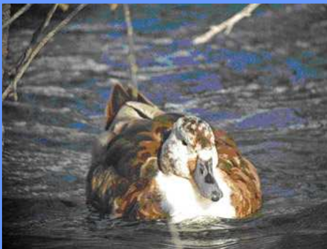
Anas platyrhynchos var. domestica . Salburua, Álava, 2009.