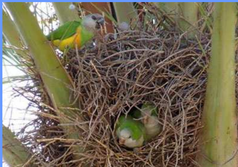
Poicephalus senegalus (arriba), Myiopsitta monachus (abajo). Mar de Cristal, Cartagena, Murcia, octubre 2008.