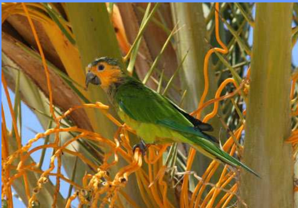
Aratinga pertinax. Santa Ponsa, Mallorca, agosto 2009.