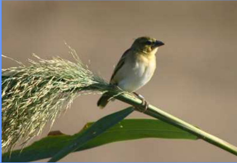
Ploceus cucullatus , tipo hembra. Doñana, Sevilla, octubre 2009.