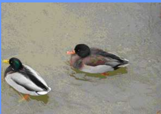
Netta rufina x Anas platyrhynchos, macho. Bilbao, Vizcaya, diciembre 2009.

● 2 ej., hembras, más 1 ej. híbrido macho, 08.12.2009, desembocadura del río Galindo, entre Sestao y Baracaldo ( Vizcaya ). El macho, resultante de la hibridación con Anas platyrhynchos , continúa el 20.12 (Serafín Alarcón). Fotos.