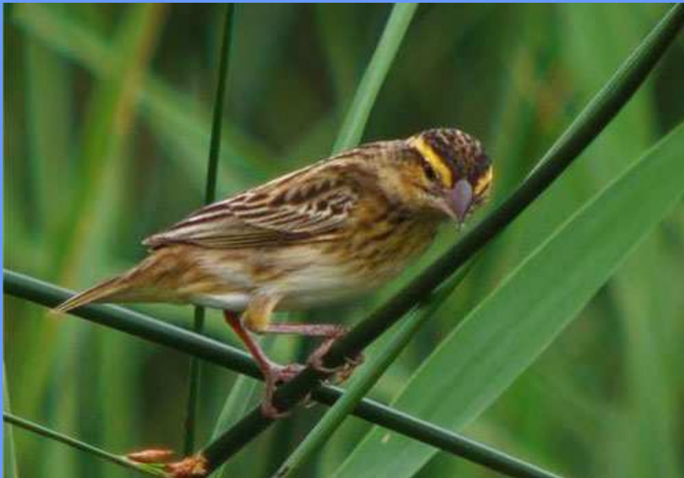
Euplectes afer , tipo hembra. Aiguamolls de l'Empordà, Girona, julio 2009.

• 2 ej., machos, 13.10.2009, R. N. de La Pipa, Tancat de la Pipa y Catarroja ( Valencia ), en zona de vegetación palustre. Previamente observado un macho el 20.07, alimentándose de gramíneas junto con Passer montanus , el 10.09 y el 25.09 (Anuario Ornít. Com. Valenciana 2009: BDJ, VET, JPH, PVG).