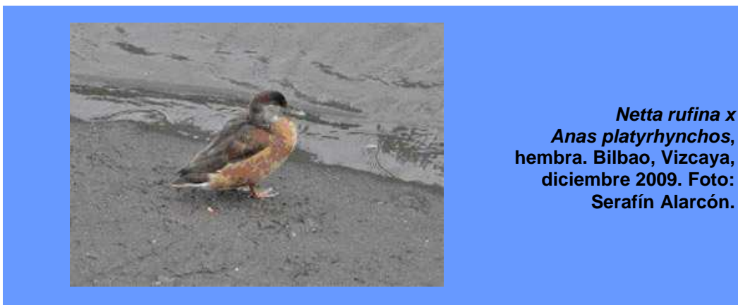
Netta rufina x Anas platyrhynchos, hembra. Bilbao, Vizcaya, diciembre 2009.