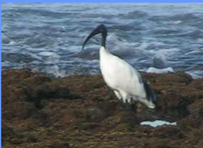
Threskiornis aethiopicus. Los Cristianos, Tenerife, febrero 2009.