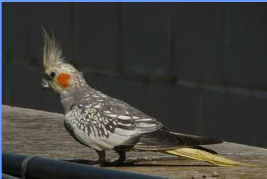
Nymphicus hollandicus . Parque de Montjuic, Barcelona, octubre 2009.

● 1 ej., 05.10.2009, Contraparada, Murcia ( Murcia ). Continúa allí varias semanas (Anuario Ornít. Murcia. 2009: FAGC).