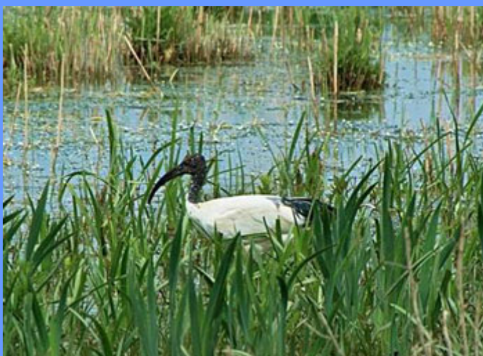
Threskiornis aethiopicus. Balsa de Loza, Navarra, abril 2009.