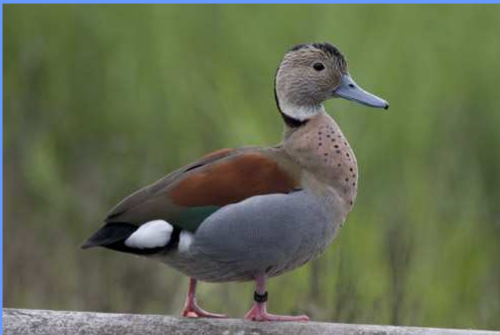
Callonetta leucophrys . Ría de Villaviciosa, Asturias, junio 2009.