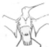
1 Indicios de Grasa. Primero en los Flancos.