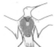
8 Totalmente cubierto.