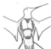
4 Interclavícula llena y flancos muy visibles.