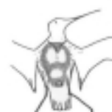
6 Musculo y abdomen solo visibles en su centro.