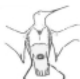
2 Interclavicular y codos visiblemente ocupados.